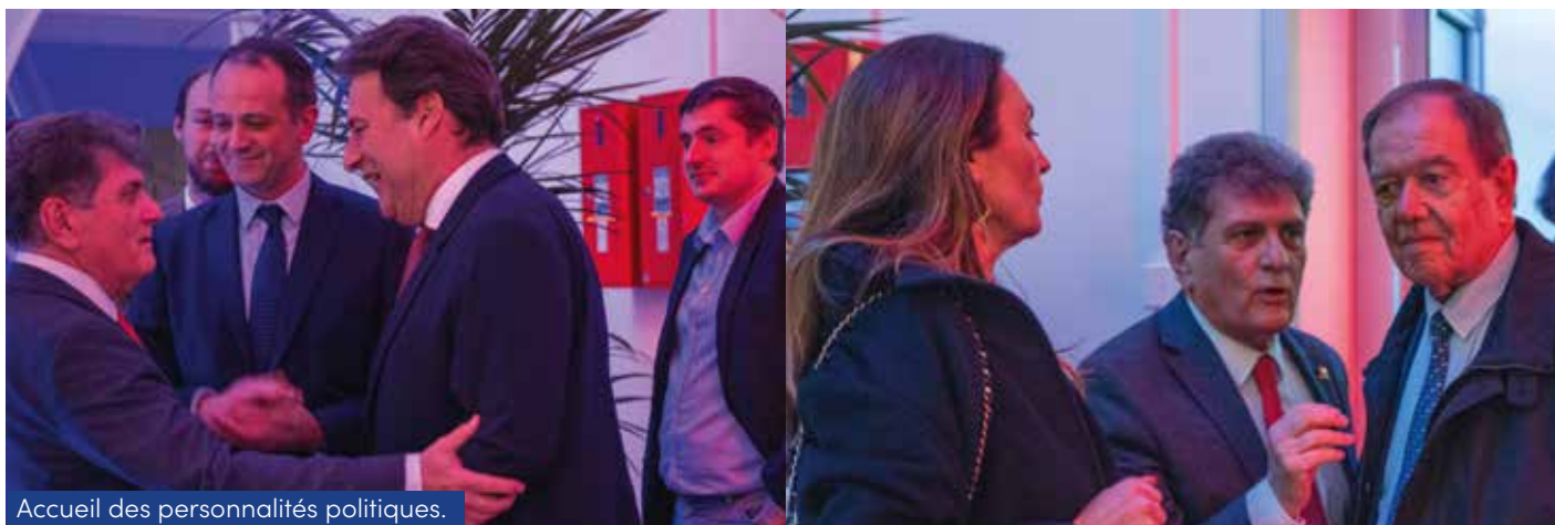
Accueil des personnalités politiques.