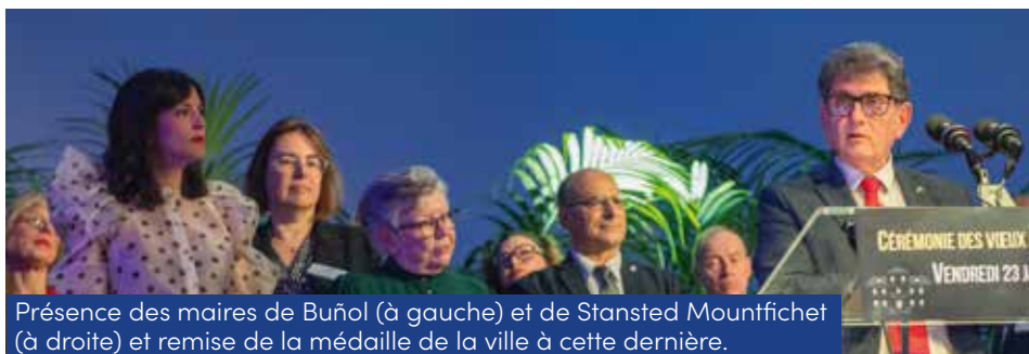
Présence des maires de Buñol (à gauche) et de Stansted Mountfichet (à droite) et remise de la médaille de la ville à cette dernière.