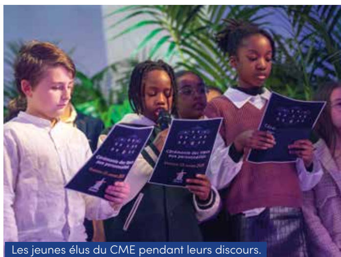
Les jeunes élus du CME pendant leurs discours.