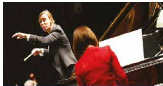
Lucie Leguay, cheffe d'orchestre dirigeant l'Orchestre National d'Île-de-France.

Festival de Saint-Denis. Désormais, il faudra ajouter à cette liste prestigieuse, le « Rungis Piano-Piano Festival », parrainé pour toujours par les sœurs Labèque !