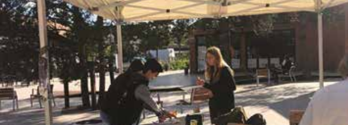
10 octobre : le CDJ participe à la collecte en faveur des sinistrés des Alpes Maritimes