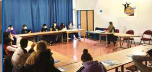
25 septembre dernier : première séance du CDJ