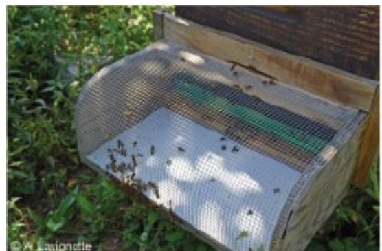
Romé, Q., Villemant, C. Le Frelon asiatique Vespa velutina - Inventaire national du Patrimoine naturel. In: Muséum national d'Histoire naturelle http://frelonasiatique.mnhn.fr

Pour protéger les ruches, une muselière peut y être installée devant la planche d'envol. Cette grille empêche les frelons d'entrer dans la ruche et permettrait de limiter de 41% la paralysie de l'activité de vol induite par le frelon qui est la principale cause de mortalité des ruches ( http://frelonasiatique.mnhn.fr/la-museliere/ ).