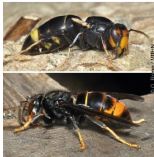
Rome, Q., Villemant, C. Le Frelon asiatique Vespa Velutina - Inventaire national du Patrimoine naturel. In: Muséum national d'Histoire naturelle- http://frelonasiatique.mnhn.fr

Au printemps, la reine est beaucoup plus grande que les ouvrières car ces dernières se sont développées dans de petites alvéoles du nid primaire.