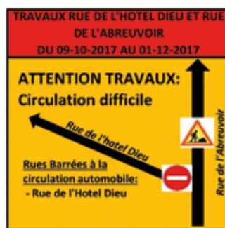
RUNGIS DE L'HÔTEL DIEU