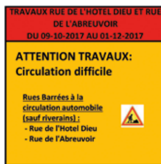
Panneau 3 - Angle Rue de l'Hotel Dieu / Rue Ste Geneviève